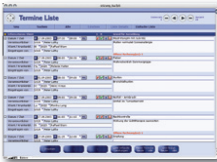
Terminliste pro Arzt mit der Möglichkeit, sofort nach der Behandlung die Leistungen zu erfassen